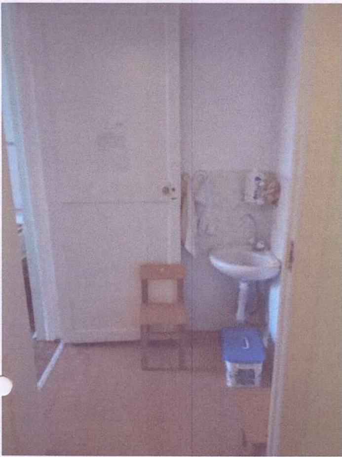
САНИТАРНАЯ ЗОНА ЛОГОПЕДИЧЕСКОГО КАБИНЕТА