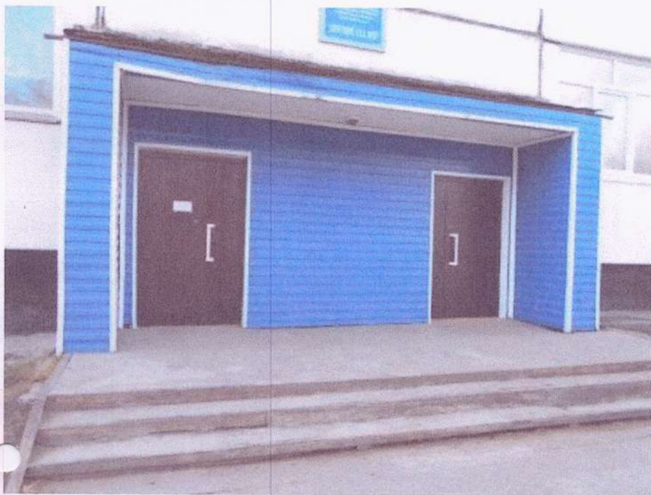
БОКОВОЙ ВХОД В ЗДАНИЕ